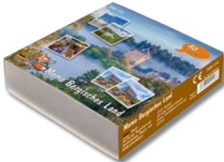
Bergisches Land FF-ME42651

= Entstanden in Zusammenarbeit mit dem Rheinischen Verein für Denkmalpflege und Landschaftsschutz