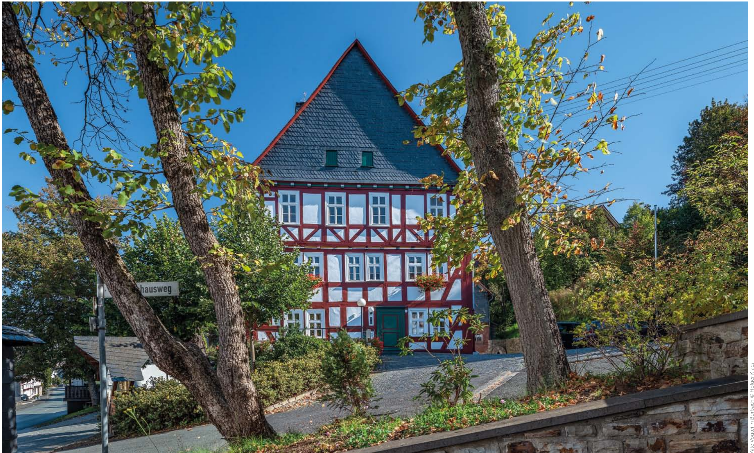
Alte Vogtei in Burbach