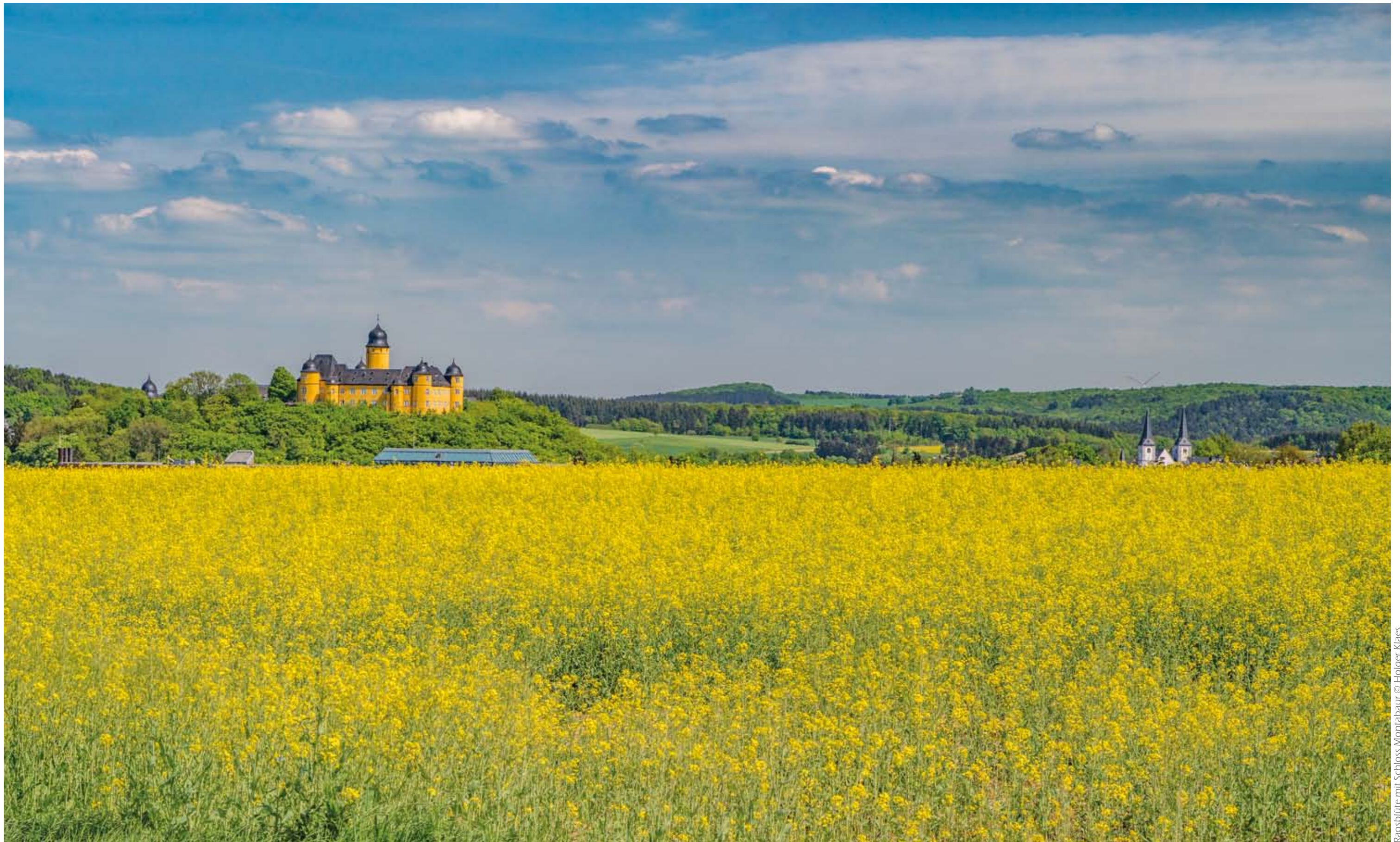
Rapsblüte mit Schloss Montabaur