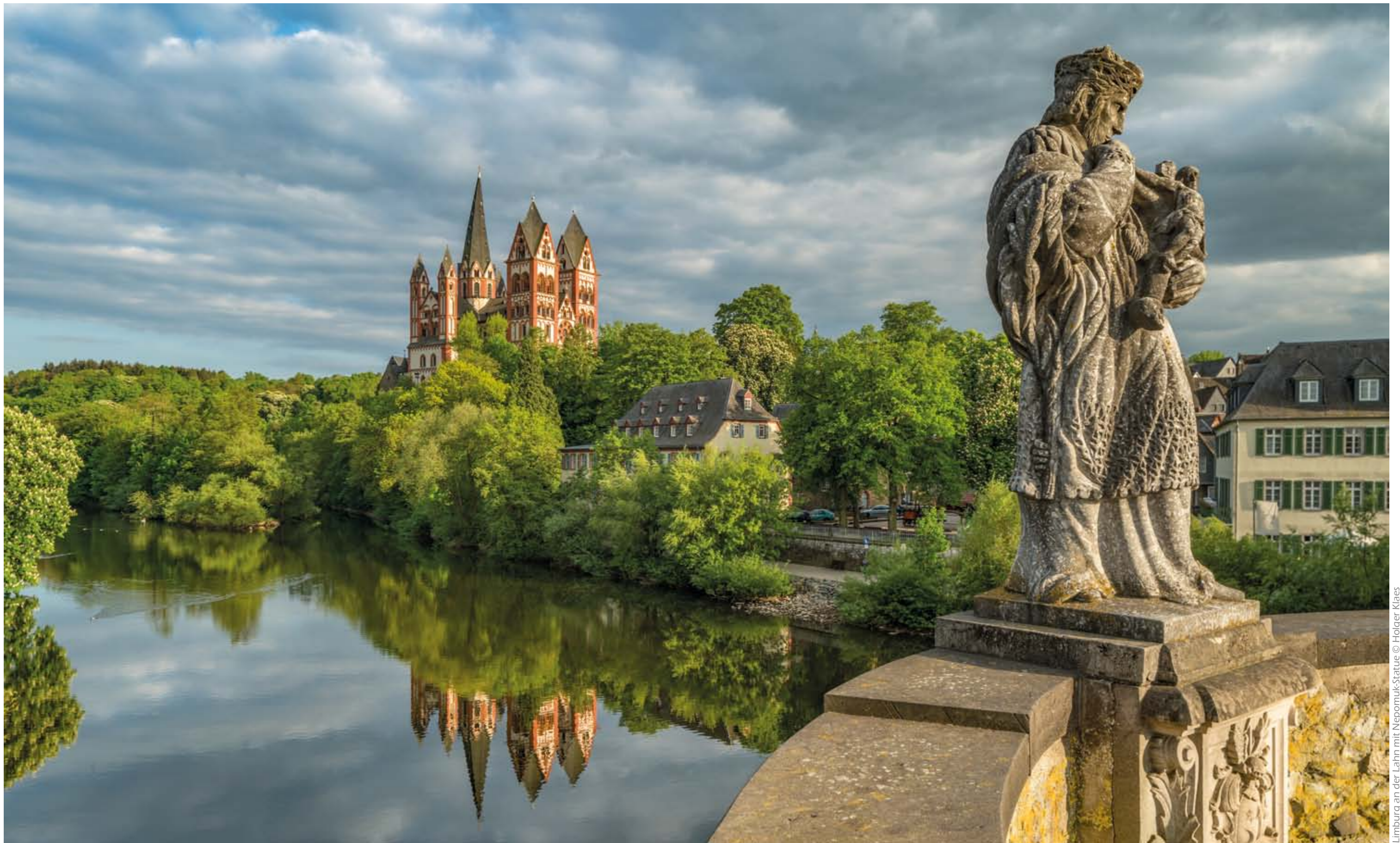
Limburg an der Lahn mit Nepomuk-Statue