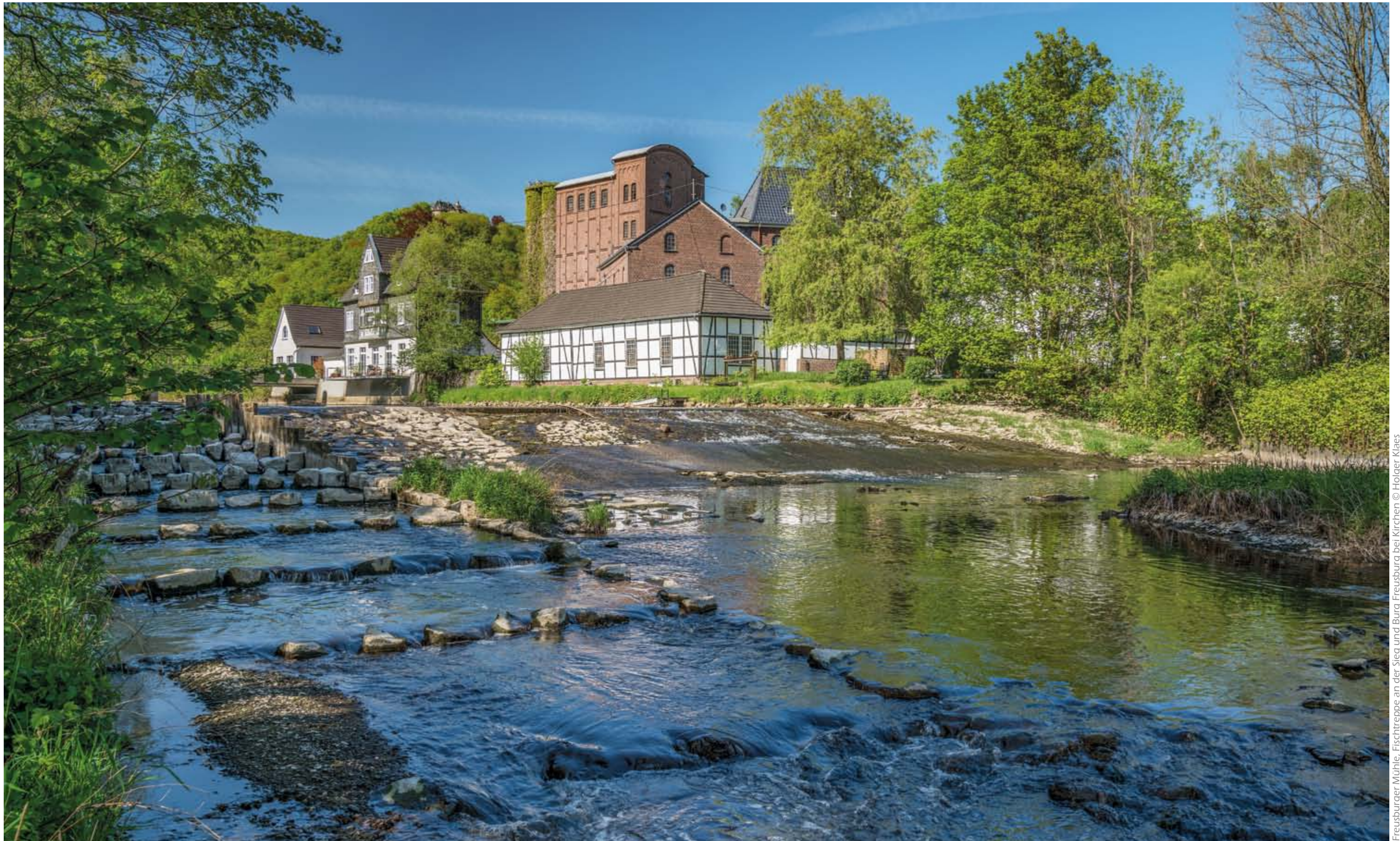
Freusburger Mühle, Fischtreppe an der Sieg und Burg Freusburg bei Kirchen