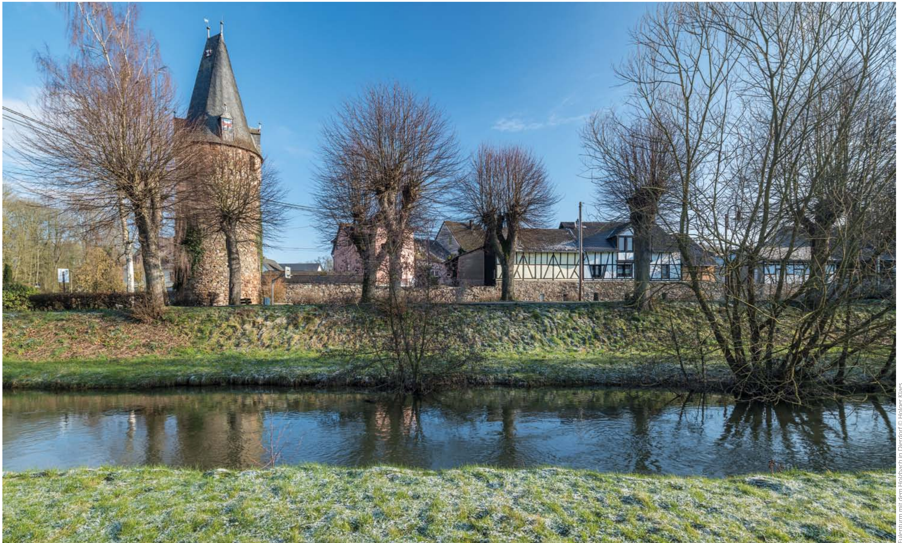
Eulenturm mit dem Holzbach in Dierdorf