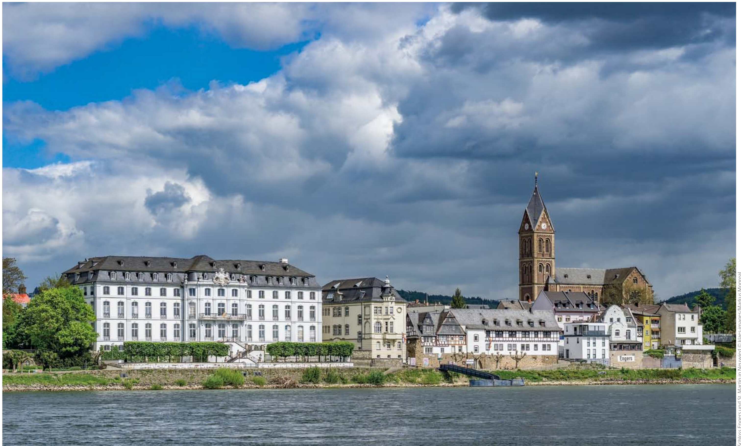
Schloss Engers und St. Martin in Neuwied