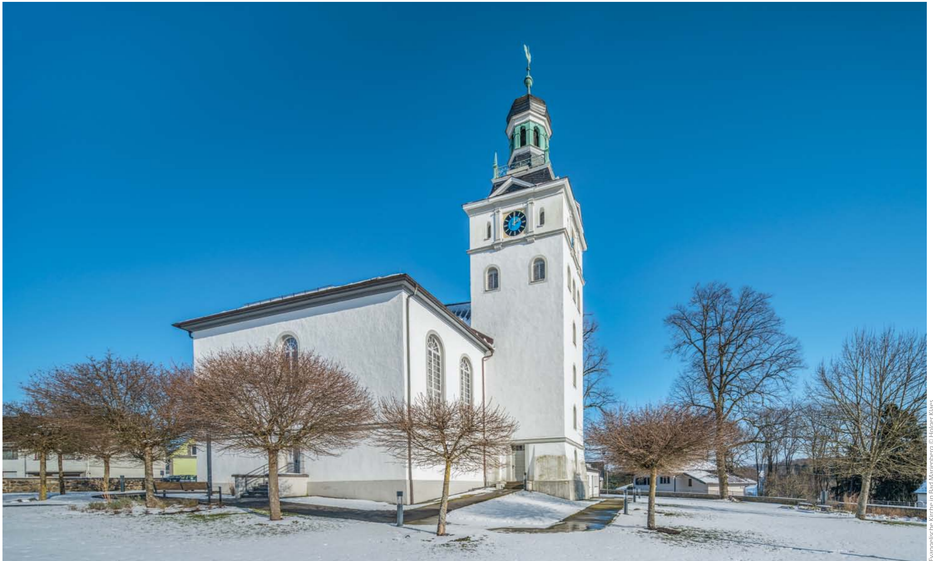
Evangelische Kirche in Bad Marienberg