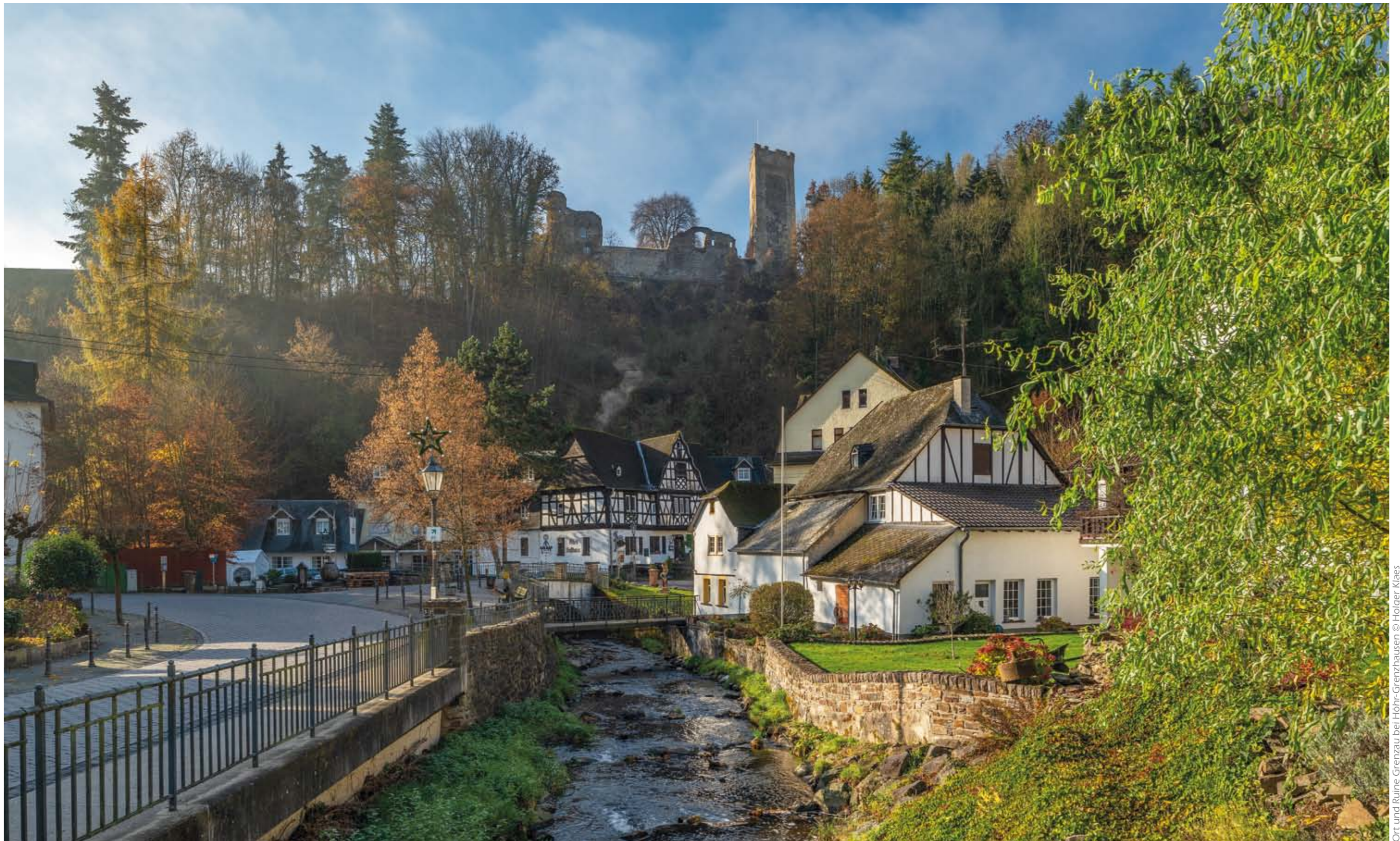
Ort und Ruine Grenzau bei Höhr-Grenzhausen